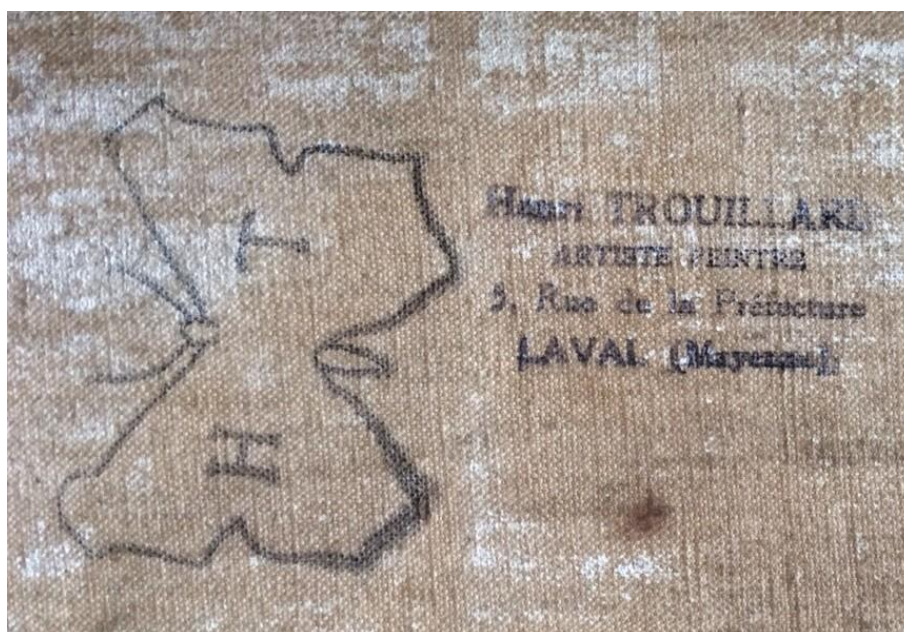
Cachet et tampon d'Henri TROUILLARD

1 / Musées de Laval - Dossier de Presse « Ma Vie » H. TROUILLARD Exposition 2015